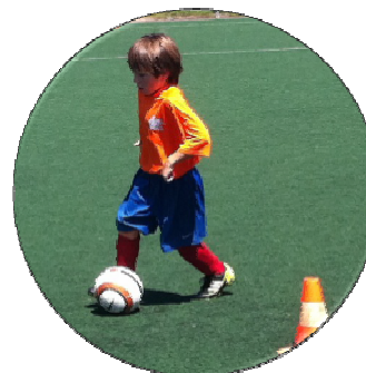
Un suivi personnalisé