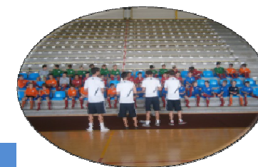
Un encadrement de qualité